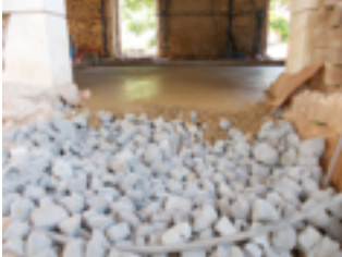
Dalle de béton d'argile de 15 cm sur hérisson de technopor