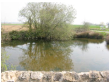
La mare à lentille refuge de grenouilles

Les caractéristiques des éléments utilisés pour l'aménagement tiendront une place essentielle dans la touche finale, les matériaux naturels apporteront du cachet et de l'authenticité tandis que les végétaux et leur floraison apporteront une coloration bienvenue.