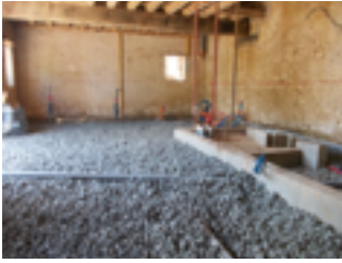
Hérisson de technopor sur une épaisseur de 20 cm